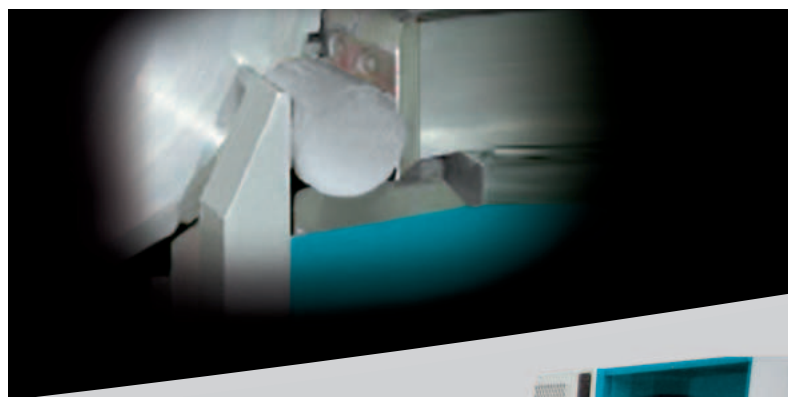
Process de coupe