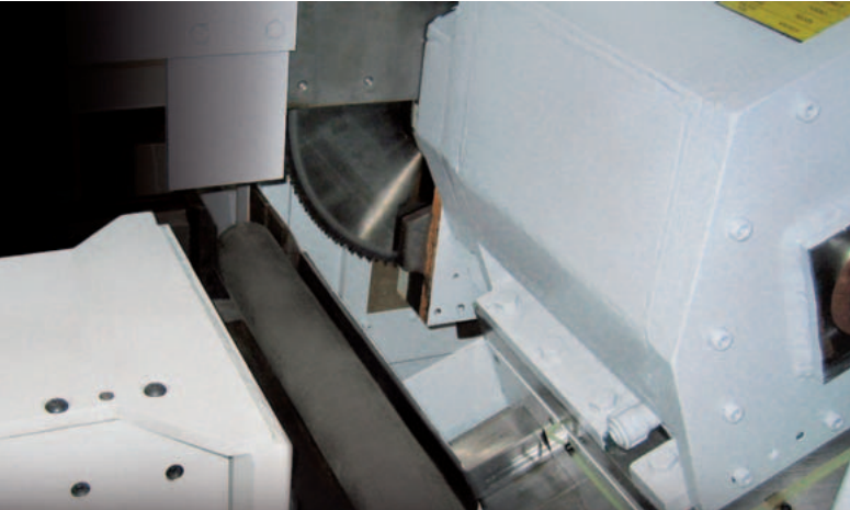
Alimentation des barres