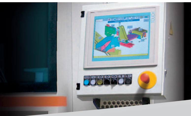
Commande KASTO EasyControl à écran tactile